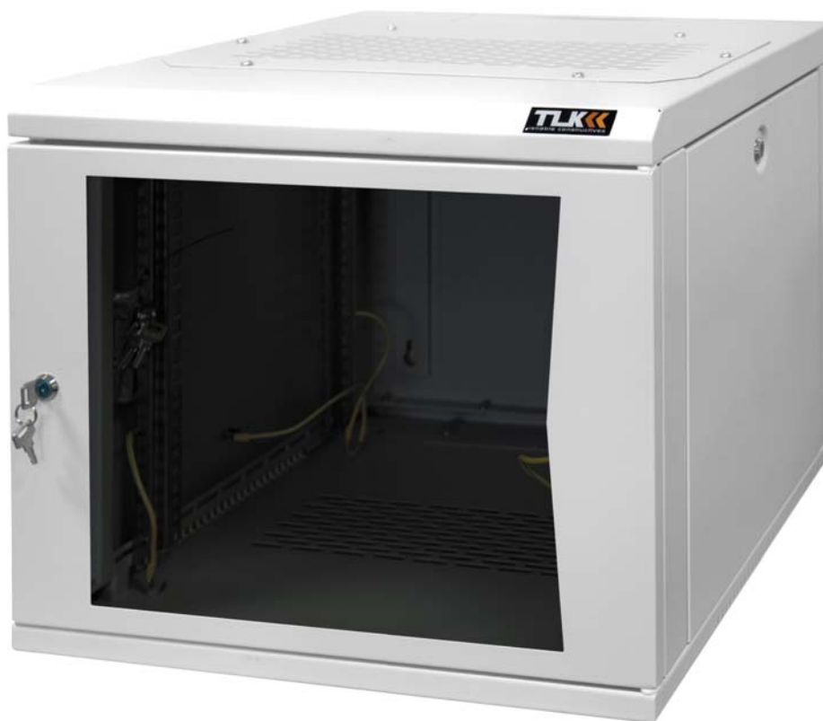
TWC-095350-G-GY Настенный двухсекционный шкаф 19", 9U, стеклянная дверь, Ш530×В466×Г500 мм, серый

Возможность установки вентиляторного блока в крышу шкафа