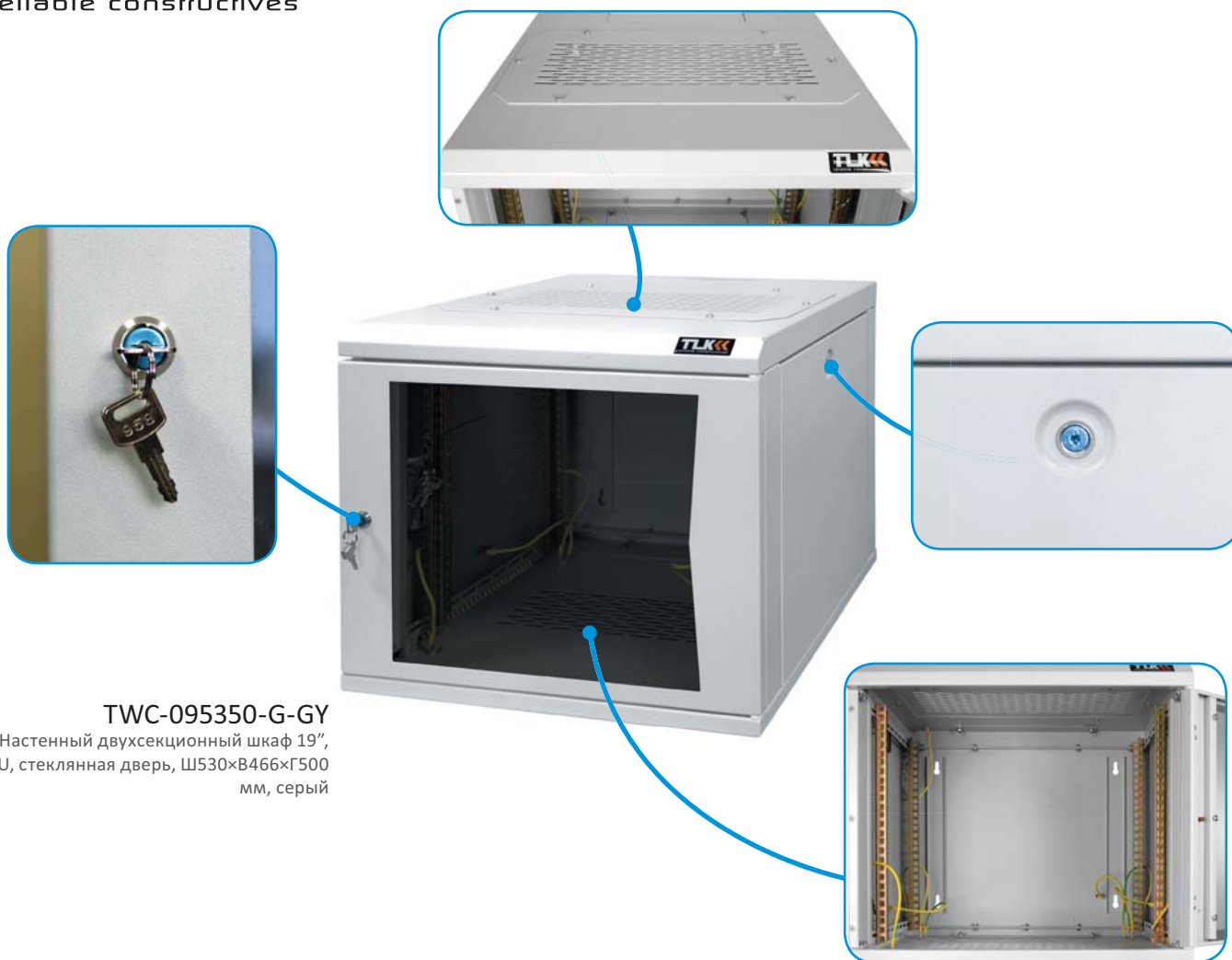
TWC-095350-G-GY Настенный двухсекционный шкаф 19", 9U, стеклянная дверь, Ш530×В466×Г500 мм, серый

Шкафы выполнены в 19" стандарте. Каркас и направляющие шкафа изготовлены из 1,5 мм стали, а боковые стенки — из 1 мм стали. Дверь шкафа снабжена замком и может быть как со вставкой из ударопрочного тонированного в массу стекла, так и глухой металлической. В комплект к замку входят 2 ключа. Для установки оборудования шкаф снабжен четырьмя оцинкованными монтажными направляющими, что позволяет устанавливать в шкаф достаточно тяжелое глубокое оборудование. Направляющие могут регулировать-